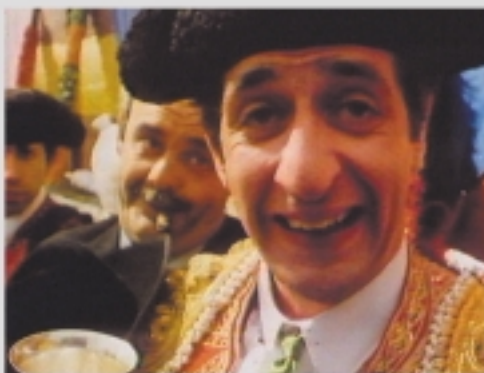
GRAN PREMIO DEL FESTIVAL 1987