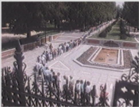
GRAN PREMIO DEL FESTIVAL 1988