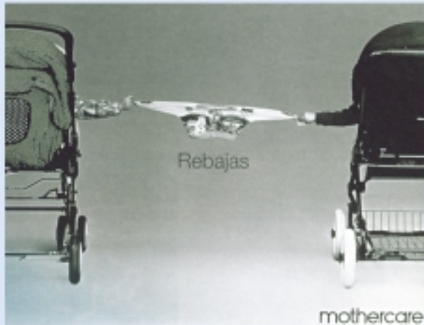
GRAFICA GRAN PREMIO DEL FESTIVAL 1997