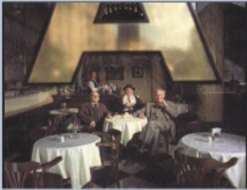
CINE/TV GRAN PREMIO DEL FESTIVAL 1997